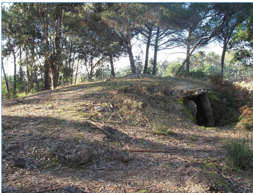
Figura 3. Vista atual da anta da Barquinha da Moura (Tondela)

Este monumento foi alvo de trabalhos de valorização, nos inícios dos anos noventa do século passado, e, apesar de se encontrar em razoável estado de conservação (Fig. 3) não se encontra integrado num sistema consolidado de monitorização, divulgação e fruição pública.