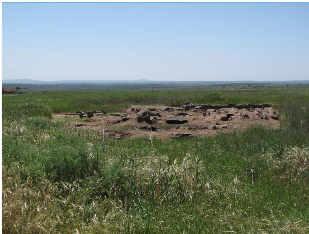
Figura 4. Vista geral da villa romana de Torre de Palma (Monforte)

Neste domínio existiram dois eixos de ação: um em que os sítios recuperados e musealizados foram escolhidos pelo Estado (central e/ou regional), e que, aparentemente, não tiveram em consideração nenhum eixo estratégico, definido a nível dos instrumentos de gestão do território. Sítios como Milreu, S. Cucufate, Miróbriga, Alcalar 7, Antas de Elvas, Santa Victória, Cabeço do Vouga e Mamoia do Taco foram intervencionados e musealizados neste contexto. No entanto, na maioria dos casos as elevadas verbas necessárias para a sua manutenção tem conduzido, nos últimos anos, a graves problemas, como o caso de Torre de Palma (Fig. 4) ou do Cabeço do Vouga (Fig. 5).