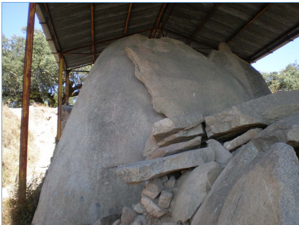
Figura 2. Pormenor de alguns dos problemas estruturais do monumento.

executar os trabalhos necessários ao seu restauro. Para além disso, o proprietário não se encontra interessado em recuperar e valorizar este sítio, e não tem mostrado vontade de colaborar numa ação conjunta com o Estado. Perante esta situação, o monumento tem-se vindo a degradar, estando atualmente algumas das suas estruturas pétreas em risco de colapso (Fig. 2).