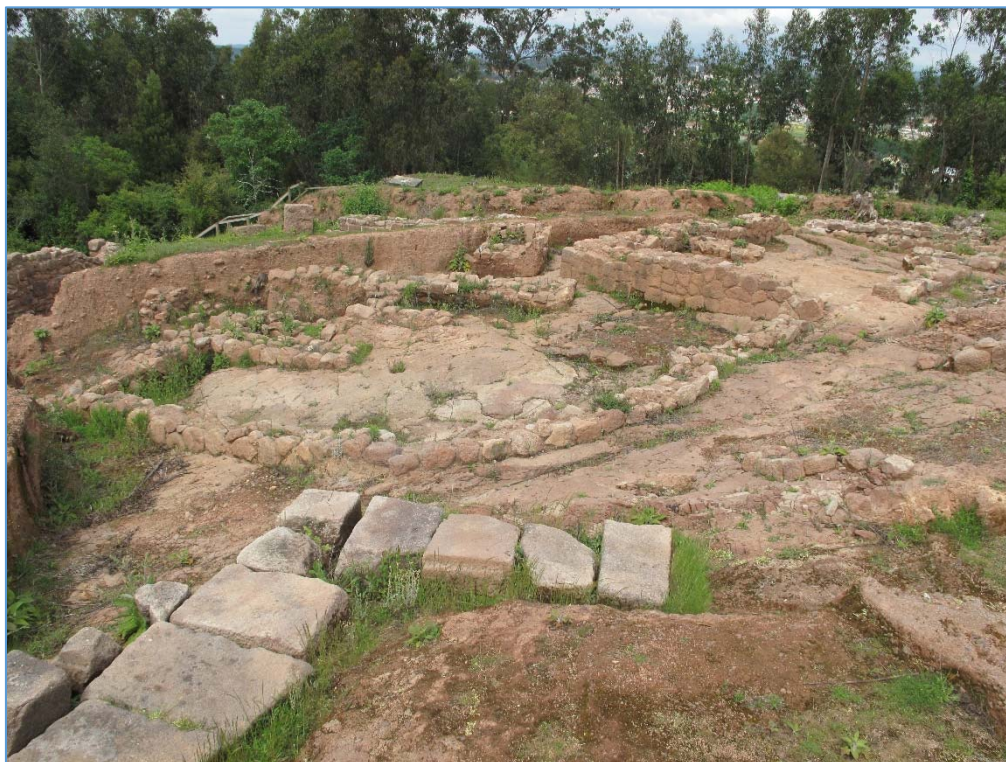
Figura 5. Vista geral do sítio de Cabeço do Vouga (Águeda)

A estação arqueológica do Cabeço do Vouga é constituída por dois cabeços aplanados - Cabeço da Mina e Cabeço Redondo - localizados entre os rios Vouga e Marnel. Possui vestígios de ocupação humana, documentada, fundamentalmente, para o período romano. Esta estação anda ligada, desde o século XIX, à problemática em torno da localização do oppidum dos Turduli Veteres – Talabriga – fundamentada numa notícia de Apiano sobre as campanhas de Décimo Júnio Bruto.