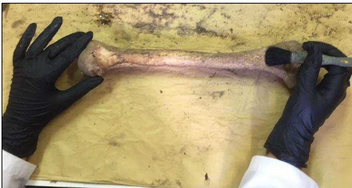
Figura 3 – Pormenor da limpeza e inventariação do material exumado na intervenção arqueológica da Igreja da Misericórdia de Vila do Porto, Santa Maria

Relativamente à ilha de São Miguel, para além do caso já descrito para Vila Franca do Campo, foram exumados materiais osteológicos de outros quatro locais.