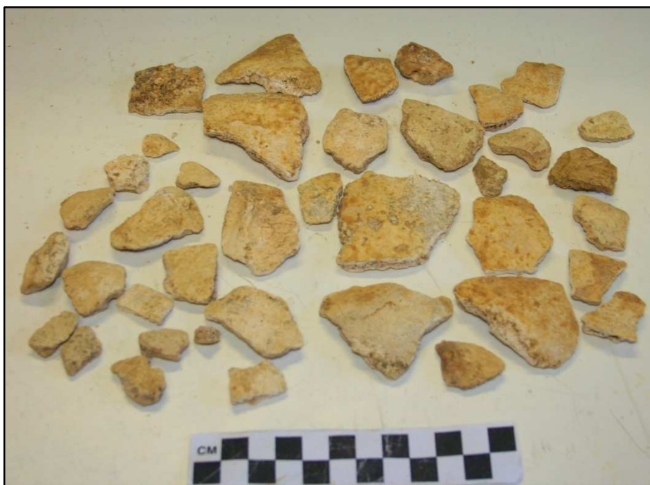
Figura 4 – Alguém do espólio descoberto durante os trabalhos de requalificação da igreja de Santo António – além – Capelas, Ponta Delgada, São Miguel (CAA 150-A, Neto et al , 2018b)

O antigo convento feminino de Nossa Senhora da Conceição, atual Palácio da Conceição, em Ponta Delgada, foi intervencionado, em 2016, no âmbito dos trabalhos de minimização de impactos arqueológicos, durante a empreitada de remodelação do imóvel com vista a acolher a futura Casa da Autonomia . Durante o acompanhamento arqueológico, foi detetado um conjunto de ossadas, posteriormente estudado pela segunda signatária, que verificou tratar-se de uma inumação secundária, ossário, com ossos de, no mínimo, três adultos, sendo, pelo menos, um deles, do sexo feminino. O estudo paleopatológico revelou uma patologia oral (cárie dentária) e algum desgaste dentário, com pouca expressão.