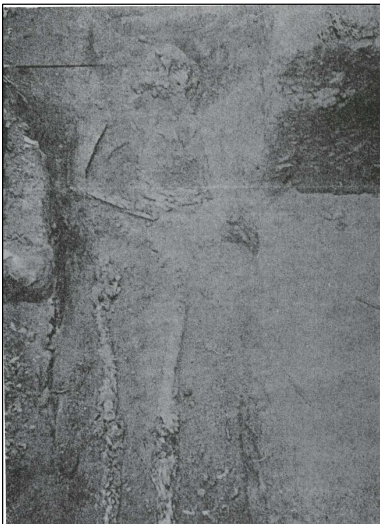
Figura 1 – Esqueleto exumado em Vila Franca do Campo durante os trabalhos de escavação arqueológica coordenados por Manuel Sousa d'Oliveira (Bento, 1990:120).

O esqueleto foi levantado e depositado na cave da antiga Escola Básica Professor António Santos Botelho, na Rua Engenheiro Artur Canto Resende, em Vila Franca do Campo. Contudo, aquando a transição definitiva desta escola, para a atual Escola Básica e Secundária de Vila Franca do Campo, na Rua Vila do Porto, perdeu-se o conhecimento da localização do material osteológico humano.