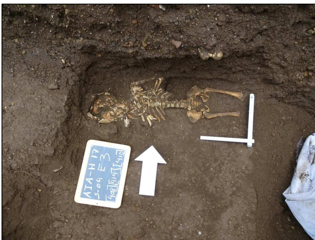
Figura 6 – Enterramento descoberto durante os trabalhos de acompanhamento arqueológico no adro da Igreja de Nossa Senhora das Angústias, Horta, Faial (Araújo et al , 2017)

O núcleo mais antigo encontrava-se associado à primitiva igreja paroquial e, possivelmente, à ermida que ali se encontrava, remontando, cronologicamente, ao século XVI, e mantendo a sua ocupação até ao XVIII. O núcleo mais recente enquadrava-se, cronologicamente, na fase de transição entre a segunda metade do século XVIII e o momento em que cessam os enterramentos naquele espaço, com a lei dos cemitérios, no século XIX. O espólio arqueológico exumado revela que se tratavam de indivíduos de aparente condição social mais modesta. Analisados os conjuntos de ossadas, o contexto e o espólio arqueológico, foi possível retirar várias conclusões sobre a evolução da ocupação do espaço, não obstante o estado variável de degradação do espólio osteológico (Araújo et al , 2017).