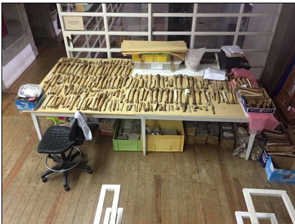
Figura 2 – Uma parte do espólio exumado durante a intervenção arqueológica na Igreja da Misericórdia de Vila do Porto, Santa Maria

Os materiais orgânicos revelam provir, muito provavelmente, de um carneiro da igreja. Aproveitando um vão, talvez que de uma primitiva escada interior de acesso ao primeiro piso, construiu-se uma parede falsa, emparedando os ossos, de modo a que estes se mantivessem próximo do local onde secundariamente haviam sido transladados. Este ossário é, consequentemente, uma deposição terciária, sendo que, atendendo a que apresenta os restos mortais de cento e vinte e três indivíduos, representados parcelarmente, maioritariamente por crânios e ossos longos, conforme ao habitual em carneiros, podemos calcular que pertenceram a mortos anteriores ao ano de 1805/6. O ante quem da sua representatividade não é calculável, evidentemente, mas é seguramente posterior a 1536, data da fundação da igreja.